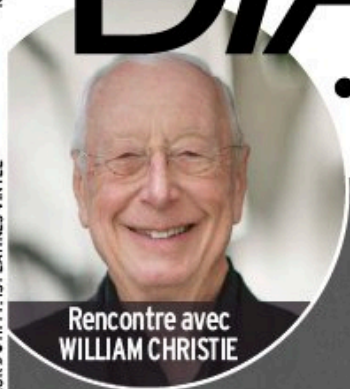
Rencontre avec WILLIAM CHRISTIE

● SEIJI OZAWA ● BEETHOVEN ● MENUHIN ADIEU À UN « L'EMPEREUR », L'ARCHANGE DE MAGICIEN ROI DES CONCERTOS LA LIBERTÉ